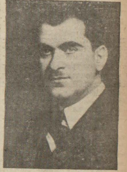
Maarif Vekili Hasan Ali Yücel