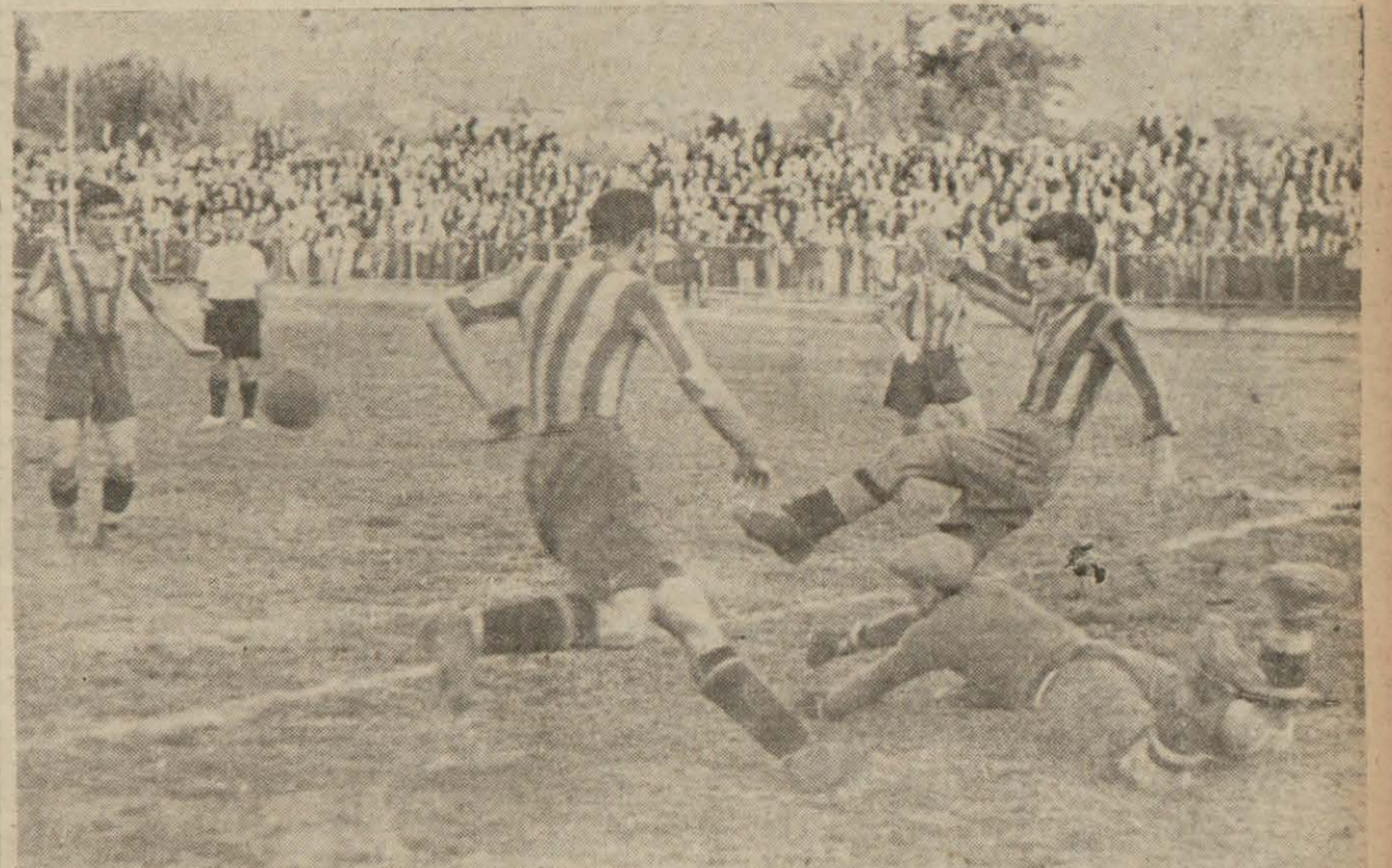
Fener - Galatasaray maçından bir intba

Beşiktaş Altıntuğu 3 - 0, Beyoğluspor Süleymaniyeyi 2 - 1 yendi, Vefa Topkap ile 1 - 1 berabere kaldı