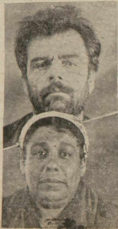
İstanbul sabıkalıların iki tipi:

Polisçe tanınmış yankesiciler, pa-pelçerler, dızdızcılar, sövüşçüler, maritacılar, karmanyolacılar, gündüz ve gece hırsızları bu nevi ceraim er-